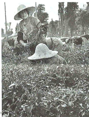
農業も化学肥料も使わないため、雑草の抜き取り作業は欠かせない(上海市内の多利農主の農場)